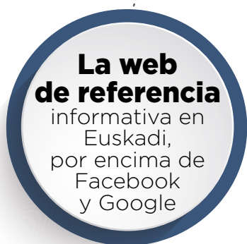
SITIO WEB TOP