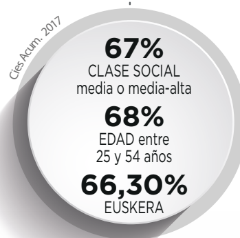
EL USUARIO MÁS INTERESANTE