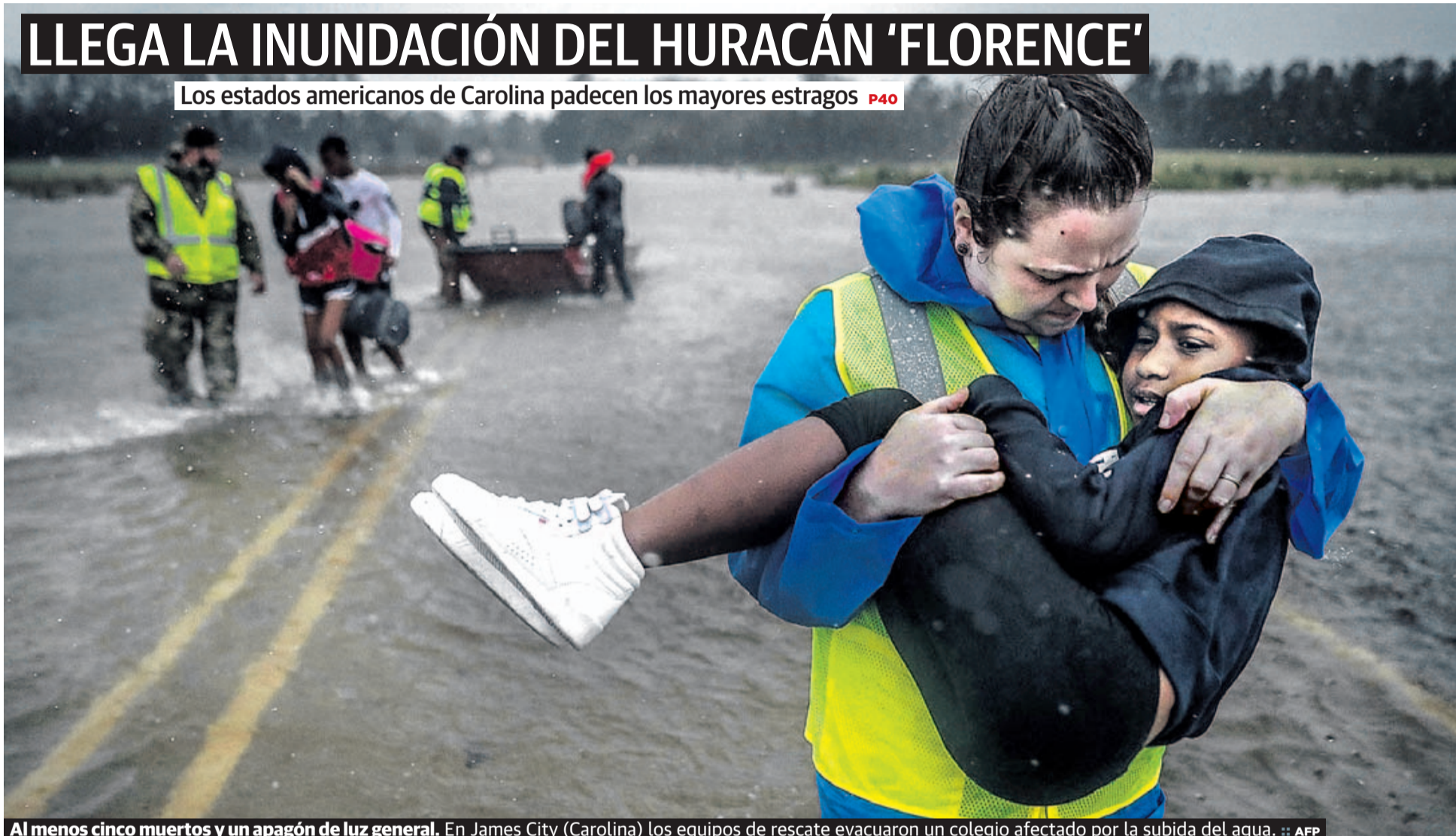
Al menos cinco muertos y un apagón de luz general. En James City (Carolina) los equipos de rescate evacuaron un colegio afectado por la subida del agua.

Los estados americanos de Carolina padecen los mayores estragos P40